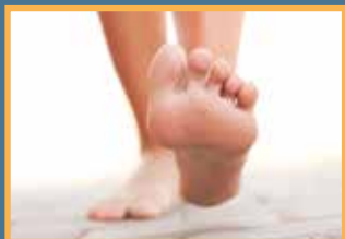
Beine & Füße

In diesen Körperregionen spielt die Nervenregeneration eine besonders wichtige Rolle.